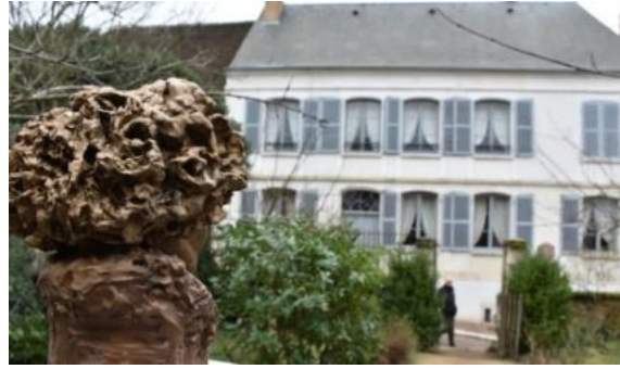
Colette contemple sa maison natale, à Saint-Sauveur (sculpture réalisée par Nacéra Kainou)