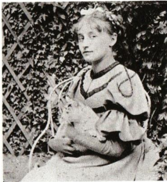
Colette dans le jardin de la maison de son frère, à Chatillon-Coligny