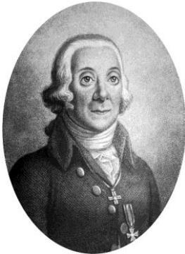
Peter Simon Pallas

Il publie en 1806 « Voyage en Crimée et sur les bords de la Mer Noire pendant l'année 1803, suivi d'un mémoire sur cette mer et les principaux ports commerciaux ». Il avait en effet accompagné le Duc de Richelieu à Odessa : ce dernier joua un rôle majeur dans l'établissement des relations de la France avec cette région.