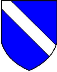
D'azur, à la bande d'argent

À l'occasion de travaux aux Archives, notre conférencier, ancien Président de la SSHNY, avait découvert ce personnage fortuitement dans les tables d'enregistrement et la teneur de ce testament excita sa curiosité. Il chercha à nous en dresser une esquisse de biographie.