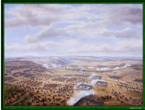
Bataille d'Auestedt par Gaspard Gobaut (1879)

En présence de deux descendants du Maréchal et des membres de l'Association Cognet qui vient de faire reproduire à l'identique le drapeau du 1 er Régiment de Grenadiers portant dans ses plis le nom d'Auerstedt, le conférencier a resitué cette bataille dans l'épopée napoléonienne en octobre 1806. Après Austerlitz, brillante victoire face aux Autrichiens et aux Russes, mais où les Prussiens n'eurent pas le temps de se joindre à la coalition et prirent ombrage de la création de la Confédération du Rhin, le sentiment anti-français ne cesse de croître à Berlin et une quatrième coalition se constitue : Prusse - Angleterre - Suède.