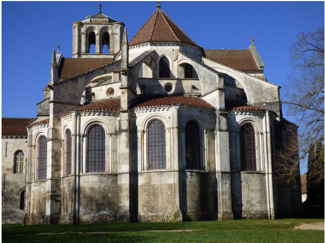
Basilique Sainte Madeleine de Vézelay